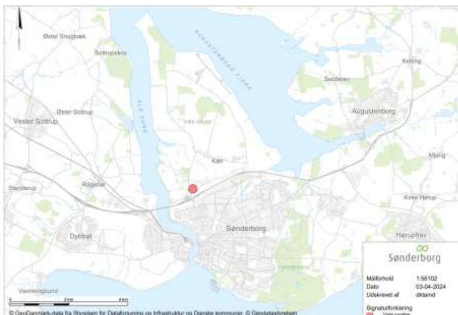
Oversigtskort som viser placeringen af Sønderborg Køreteknisk Anlæg markeret med rød cirkel.