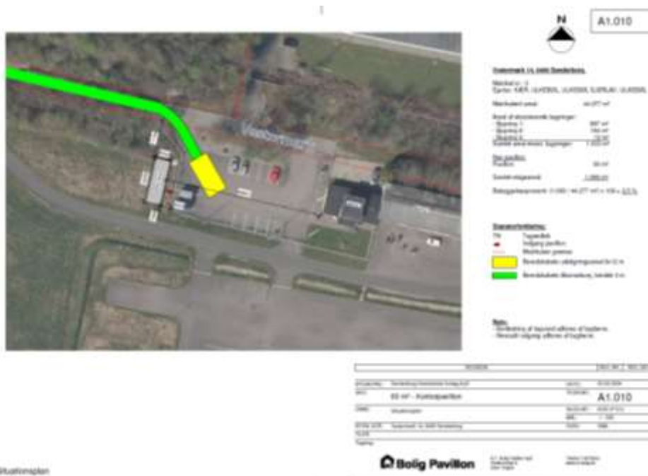
Situationsplan som viser placering af kontorpavillon og beredskabsveje.

Pavillonen opføres af følgende materialer: