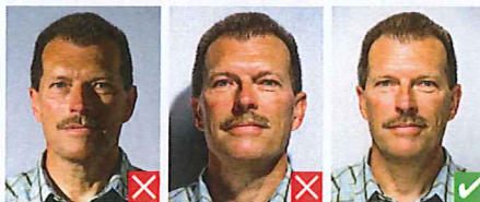
Skygge på ansigt Skygge på baggrund

Belysningen skal være jævn og må ikke lave skygger i ansigt eller på baggrund.