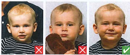
Flere personer Flere motiver