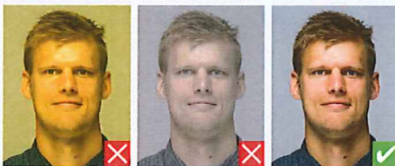
Unaturlige farvetoner Udvaskefarver

Billeder af personer med hvidt/lyst hår og personer med lyst tørklæde skal have en baggrund i skarp kontrast.