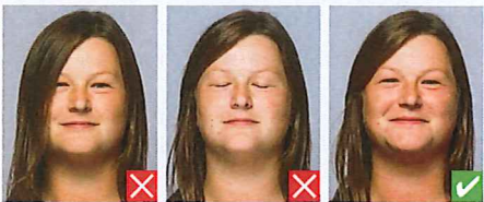
Øje dækket af hår Lukkede øjne

Der må kun være én person på billedet, som skal være taget lige forfra. Baggrunden skal være uden motiver og i ensartet lys farve, f.eks. lys blå eller lys grå. Billedet skal være i farve eller sort/hvid.