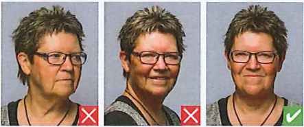
Kigger væk Hoved skævt

Blikket skal være rettet mod kameraet, øjnene helt synlige og munden lukket.