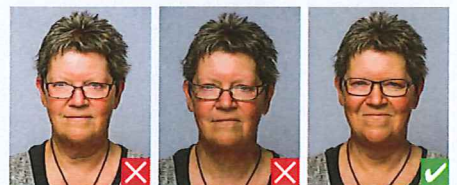
Stel dækker øjne Stel dækker øjne

Øjnene skal være helt fri af stellet og glassene uden toner eller refleksjer.