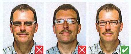
Farvede glas Refleksion i glas