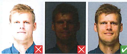
For lyst, skarp blitz For mørkt