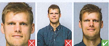
For tæt på For langt væk

Blikket skal være rettet mod kameraet, øjnene helt synlige og munden lukket.