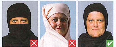
Ansigt dækket Skygger for ansigt

Hovedbeklædning tillades kun af religiøse grunde. Pande, hageparti og kindben skal være synlige.