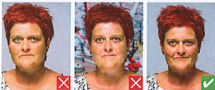
Ikke centreret Flerfarvet baggrund

Der må kun være én person på billedet, som skal være taget lige forfra. Baggrunden skal være uden motiver og i ensartet lys farve, f.eks. lys blå eller lys grå. Billedet skal være i farve eller sort/hvid.