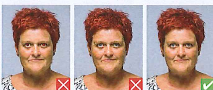
Røde øjne Grynet/pixeleret

Billedet skal være af god kvalitet og uden huller, stempler eller andre skader.