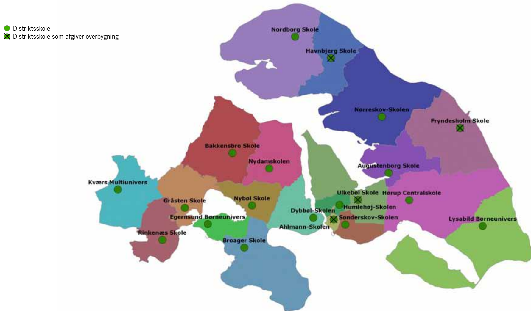
Figur 2A: 20 skoledistrikter. 20 skoler hvoraf 4 skoler afgiver overbygning