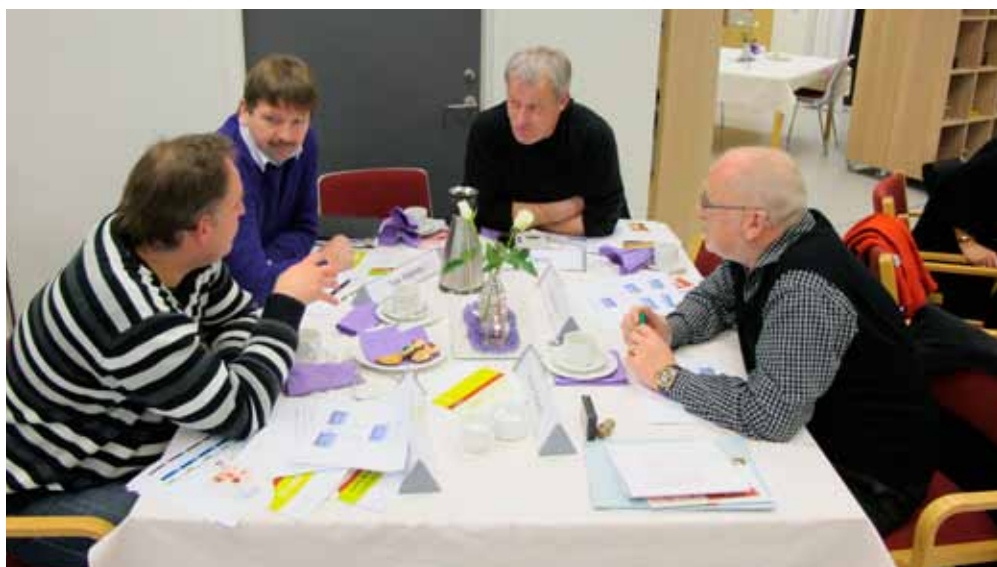
Ældreplanens temaer blev diskuteret på byrådsseminar 18. januar 2011.