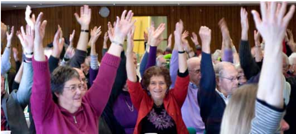
Motion for alle på borgermøderne

Der er delte meninger blandt borgerne om, hvorvidt "samfundet" skal blande sig i borgernes livsstil og stille krav om, at de lever sundt. Nogle fremhæver borgerens suveræne ret til at bestemme, hvordan livet skal leves. De peger på, at det offentlige kun bør oplyse borgeren om sundhed og tilskynde til at ændre livsstil, men borgeren bestemmer selv i sit liv. Borgeren skal dog kende konsekvensen af sine valg og træffe sit valg på et oplyst grundlag. Kommunen