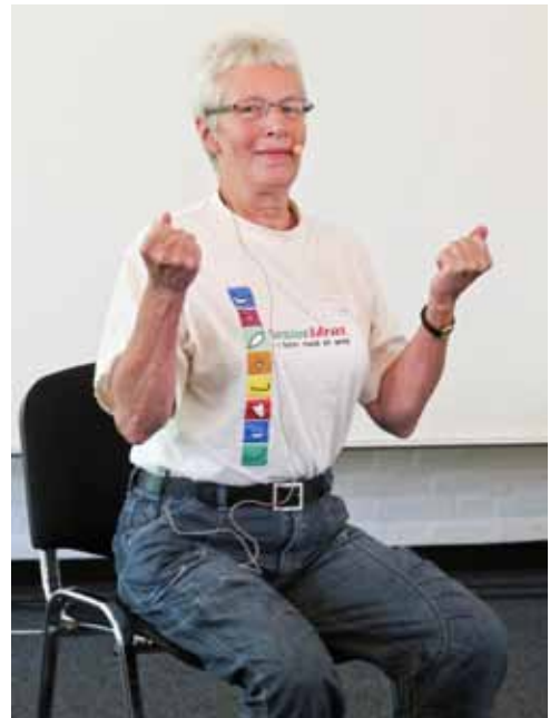
På borgermøderne var der instruktion i "Stol på motion"

boligen. Et fællestræk er, at man ønsker hjælp til at etablere netværk, når man flytter til en anden bolig, fordi man er kommet i en anden livsfase. Borgerne foreslår, at ansvaret for sådanne aktiviteter både placeres hos frivillige og professionelle.