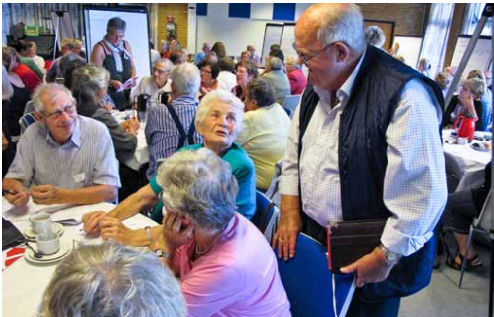
Borgermøde i Gråsten

Da sygehusene behandler en stadig større del af deres patienter ambulant eller i løbet af få dages indlæggelse, overdrages et stigende antal opgaver til medarbejderne i hjemmeplejen, på plejecentrene og i hjemmesygeplejen, når borgerne udskrives. For at være på forkant med udviklingen vil vi i Ældreservice have