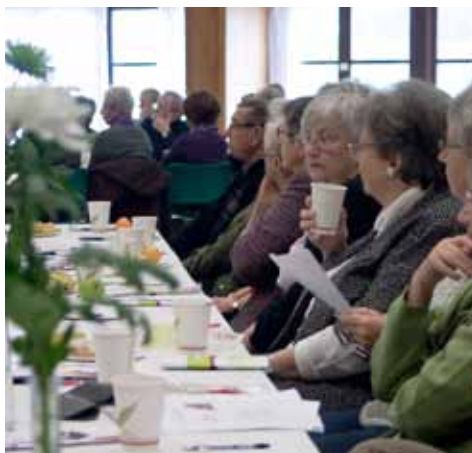
Borgermøde i Frihedshallen i Sønderborg

om at blive respekteret som den, de er, og at få hjælp til deres individuelle behov. Hvis ikke det offentlige kan yde al den hjælp, der er behov for, er der vilje til selv at betale for tilkøbsydelser. Borgerne ønsker at gå i dialog med Ældreservice og vil selv have indflydelse på, hvordan hjælpen tilrettelægges fra dag til dag. Ønsket er at være selvhjulpne og afgive sin selvstændighed i mindst muligt omfang. For at bevare værdigheden foreslår nogle borgere, at alderdommen tilrettelægges på forhånd, idet man drøfter ønsker og muligheder med sine pårørende.