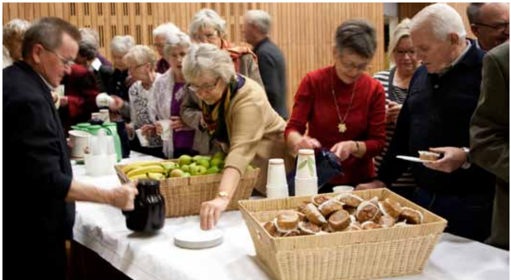
Borgermøder i Sønderborg