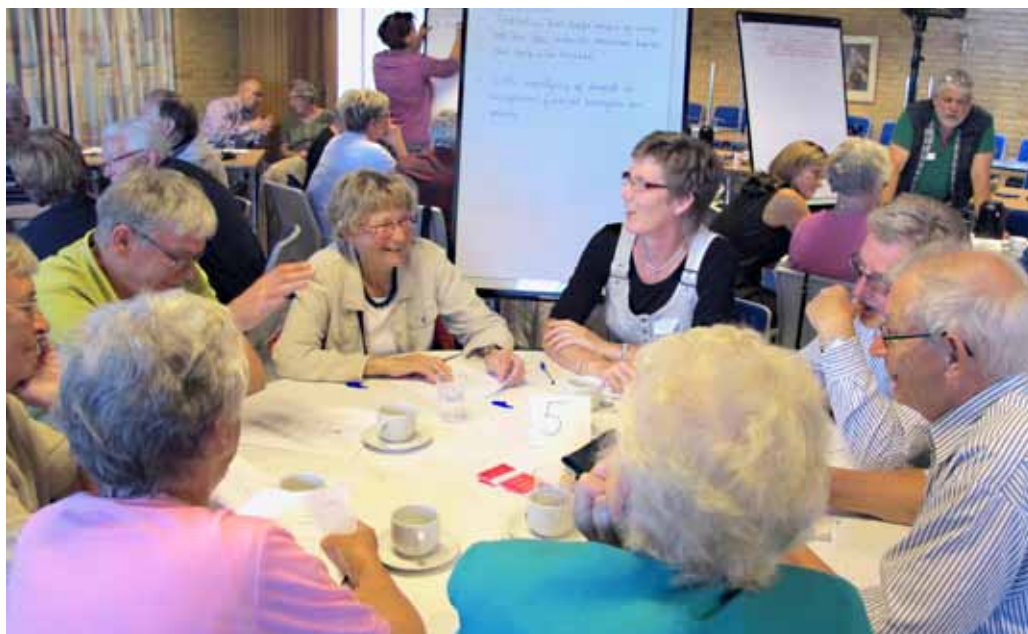
Borgermøde i Gråsten

Borgerne er overvejende enige om, at boligen skal give tryghed og mulighed for fællesskab. For nogle borgere er tryghed,