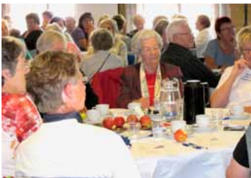
Borgermøde i Gråsten

” Ældre bliver jo ikke anderledes i 2020 - er man gammel og svag, skal der stadigvæk holdes i hånd